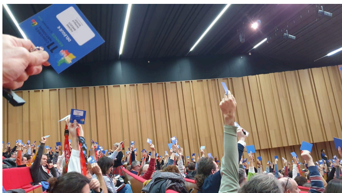
Votes des délégué·es des sections départementales, tendances, et syndicats nationaux

L'inscription de la cellule de veille contre les violences sexistes et sexuelles (VSS) dans les mandats de la FSU, mais aussi la possibilité de réaliser des réunions non mixtes, d'établir une parité effective à tous les niveaux d'actions et de responsabilité, et de s'ancrer dans une politique de rupture vis à vis du patriarcat.