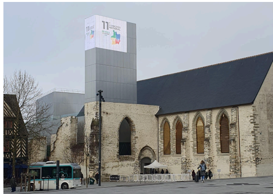
Couvent des Jacobins, Centre des Congrès de Rennes